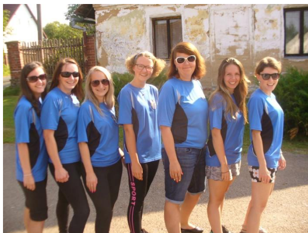
Družstvo žen z Číhaně

Hasičská soutěž v rámci oslav 120. výročí založení SDH Sedliště byla zahájena slavnostním průvodem, kdy se soutěžní družstva přesunula z návsi na místní hřiště. Za průvodem jela též doprovodná hasičská vozidla jednotlivých soutěžních družstev. U kapličky na návsi proběhlo, za doprovodu národní hymny, slavnostní položení věnce před památníkem padlým rodákům. Po slavnostní ceremonii následoval nástup soutěžních týmů, kde jsme si vyslechli stručnou historii místního hasičského sboru. Pokračovalo se předáváním významných ocenění některým členům SDH Sedliště za jejich činnost ve sboru.