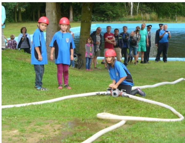
Požární útok dětí z Číhaně

Soutěžilo se ve dvou disciplínách. A to v požárním útoku, kdy družstvo po odstartování muselo přeplout koupaliště na raftu, což se setkalo s nadšeným ohlasem u přihlížejících. Po vylodění pokračovala družstva již v klasickém požárním útoku. Zvítězil mladší tým mužů z Číhaně, před Kolinem a starším číhaňským družstvem. U dětí vyhrál Zavlekov a u žen opět místní číhaňské družstvo. V druhé disciplíně se soutěžilo v přetahování lanem, kde největší sílu ukázali hoši staršího číhaňského týmu.