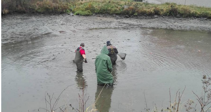
Výlov rybníka Dolina

Spolek Přátel vepřů provedl výlov rybníka zvaného Dolina. Tato událost se setkala s velkým zájmem a to hlavně těch, kteří se zajímají o rybářství. Sešli se zde lidé nejen z Číhaně, ale ze širokého okolí.