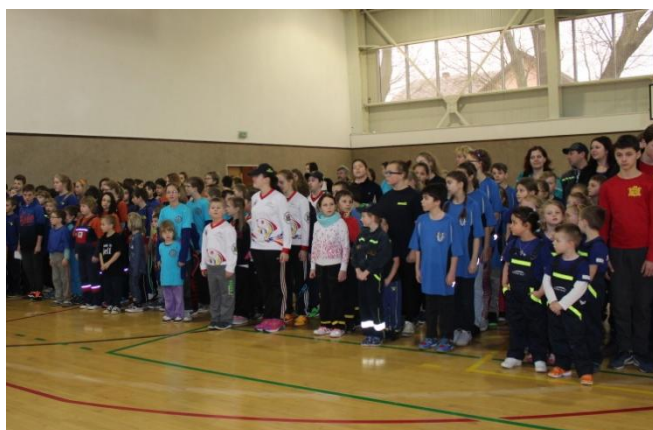
Zimní setkání mladých hasičů v Nýrsku

Byl sborem uspořádán hasičský bál za vyhrávání už tradiční kapely z Kolince zvané Andromeda. Bál měl pohodový průběh s účastí kolem devadesáti zábavně naladěných hostů. Zpestřen byl celkem slušnou tombolou a dámskou volenkou. Zábava skončila jako již tradičně v brzkých ranních hodinách. A ani v tu dobu se některým jedincům nechtělo domů.