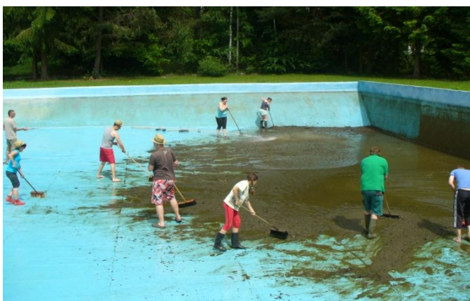
Brigáda - čištění místního koupaliště

V loňském roce byla provedena celková oprava včetně nového nátěru. Část finančních prostředků na tuto opravu se podařilo získat z dotace Plzeňského kraje. Akce se zúčastnilo 20 spoluobčanů. Tento počet zúčastněných je zklamání, protože v parných dnech je koupaliště celkem hojně využíváno a to i lidmi z místních chat a chalup.