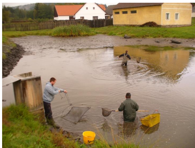
Výlov rybníka na návsi

V sobotu 8. 10. se uskutečnil výlov rybníka na návsi místním spolkem nazývaný Přátel vepřů. Výlov proběhl od ranních hodin skoro do samého poledne. Jedná se o velice náročnou práci v nepříliš příznivých podmínkách. K radosti účastníků byl výnos nadprůměrný, je to taková odměna za celoroční práci kolem tohoto rybníka. Na závěr byly úlovky přebrány, kdy menší kusy se vrátily zpět na chov a větší se užijí k přípravě různých rybích pochutin. Překvapila mě malá účast přihlízejících diváků, což nebývalo zvykem a výlov vzbuzoval značný zájem. Bylo to dáno malou informovaností.