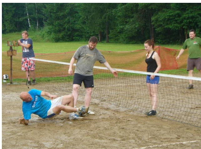
Turnaj v nohejbalu