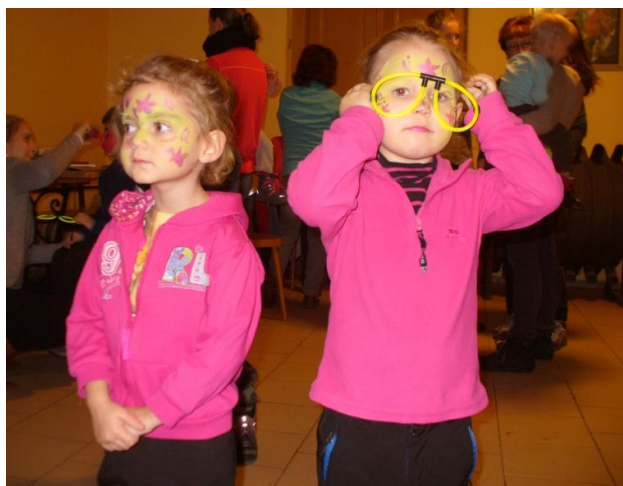
Malování na obličej