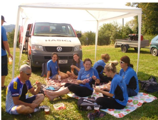
Oslavy 120. výročí založení SDH v Sedlišti