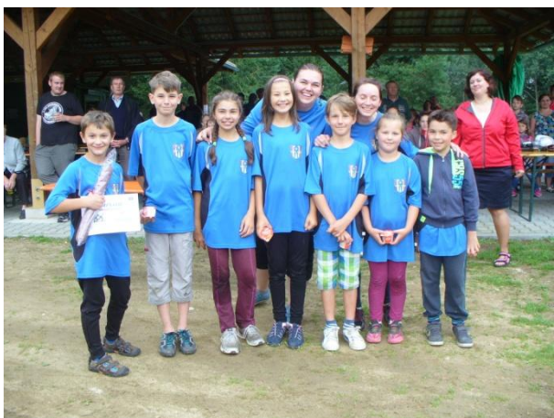
Družstvo dětí z Číhaně

Celé odpoledne sklidilo úspěch u velkého počtu diváků, což je naším hlavním cílem. Večer, jak již tradičně, rozjela svoji show kapela Skalanka. Přišlo si zatančit kolem 120 lidí. Po desáté hodině večerní byla provedena ukázka vodní světelné fontány, která byla odměněna potleskem od návštěvníků večerní zábavy. Potom pokračovala tancovačka do pozdních nočních hodin. Celou akci hodnotíme jako velice úspěšnou. Přišlo i o něco více členů na závěrečný nedělní úklid než obvykle. K večeru se ještě někteří z nás zúčastnili, jako přihlížející, vzletu horkovzdušného balónu, což zde není tak obvyklé.