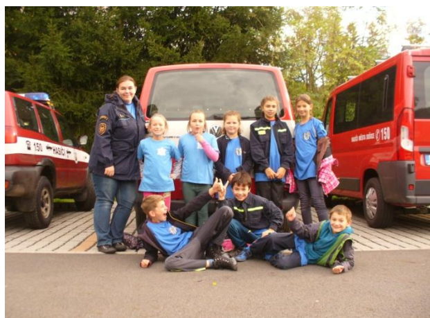
Družstvo mladých dětí z Číhaně

V tuto sobotu se zúčastnilo naše družstvo mladých hasičů podzimního kola hasičské soutěže Plamen v Nýrsku. Soutěž se skládá ze dvou disciplín a to štafety 8x50 m a běhu na 2,5 km. U štafety se předává jako štafetový kolík proudnice a v osmi drahách se překonávají připravené překážky. U běhu je trasa vedena volnou přírodou se stanovišti, kde se plní tyto úkoly: střelba ze vzduchovky, určování azimutu, topografie, zdravotvěda, přeručkování zavěšeného lana, použití hasičských přístrojů a vázání uhlů.