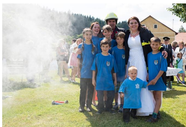
Svatba - zatahování od mladých hasičů