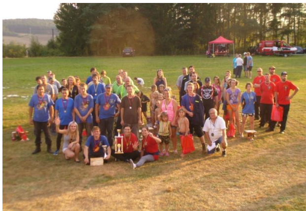
Oslavy 120. výročí založení SDH Sedliště