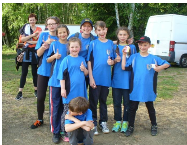
Družstvo dětí z Číhaně

V ten den se vydařilo velice pěkné počasí, což přilákalo kolem sto padesáti diváků. Je to velmi pěkná účast, která v minulých letech rapidně klesala na těchto soutěžích. Co se týče sportovních výsledků, velice dobře si vedla naše družstva žen a dětí, která ve svých kategoriích zvítězila. Velice špatně je hodnocen výsledek družstva mužů, které obsadilo předposlední místo. Je to důsledek špatné přípravy, jenž s sebou nese malý zájem o tento sport. Já osobně preferuji činnost sboru ve prospěch veřejnosti než sportovní výsledek. Nicméně to není důvod, proč by se měl název Číhaň pohybovat na konci výsledkových listin. Toto bude třeba do budoucna zlepšit.