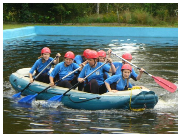
Družstvo žen z Číhaně