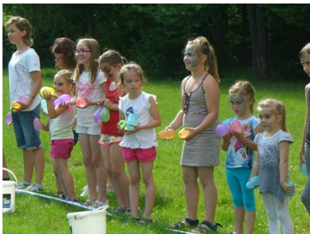
Dětský den - vodní bitva

Po splnění jednotlivých disciplín následovaly soutěže společné.