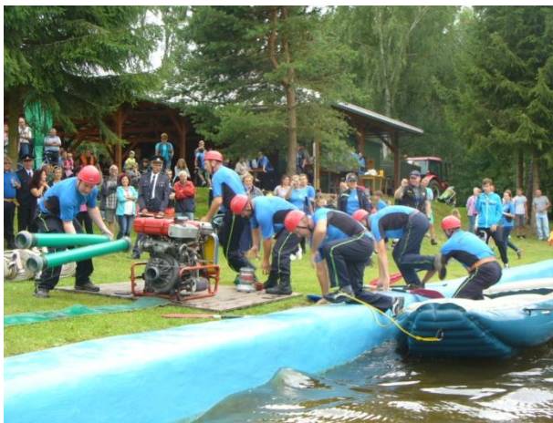
Družstvo starších mužů z Číhaně

Celé odpoledne sklidilo úspěch u velkého počtu diváků, což je naším hlavním cílem. Večer, jak již tradičně, rozjela svoji show kapela Skalanka. Přišlo si zatančit kolem 120 lidí. Po desáté hodině večerní byla provedena ukázka vodní světelné fontány, která byla odměněna potleskem od návštěvníků večerní zábavy. Potom pokračovala tancovačka do pozdních nočních hodin. Celou akci hodnotíme jako velice úspěšnou. Přišlo i o něco více členů na závěrečný nedělní úklid než obvykle. K večeru se ještě někteří z nás zúčastnili, jako přihlížející, vzletu horkovzdušného balónu, což zde není tak obvyklé.