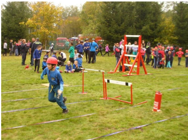
Soutěžní disciplína - štafeta 8x50 m

Překvapilo mě a hlavně potěšilo rozhodnutí několika našich členek sboru, hlavně ze soutěžního družstva, nafotit kalendář na rok 2017 s hasičskou tematikou. Kalendář by měl sloužit pro potěchu všech obyvatel obce. Fotilo se na návsi, na hřišti u koupaliště i v samotném koupališti. Focení proběhlo řízené profesionálem Tomášem Maškem. Mrzí mě, že nějakou aktivitu zorganizovat, něco připravit nebo vypomoct, až tak nevyvíjí mužská část našeho sboru (tím nemyslím všechny).