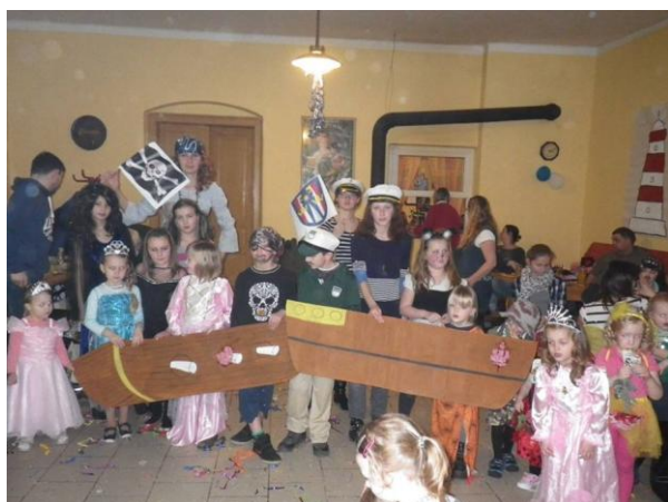
Dětský maškarní ples

Proběhla výroční valná hromada číhaňského sboru, kde byl vyhodnocen rok 2015. Dobře dopadl stav účtu, který se přes větší nákupy nezměnil, výše se dorovnala výdělkem z uspořádání zábav. Největší investice byla do opravy motoru historické stříkačky Sigmund, kterou sbor vlastní. Kritiku sklidila malá účast na brigádách, s kterou se náš sbor potýká. Po vyřízení všech náležitostí proběhla volná zábava, kterou zpestřila ke spokojenosti všech dechová kapela Černí Baroni z Klatov.