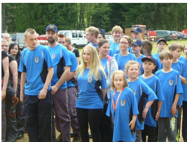
Okrsková soutěž Číhaň - místní družstvo mužů, žen a dětí