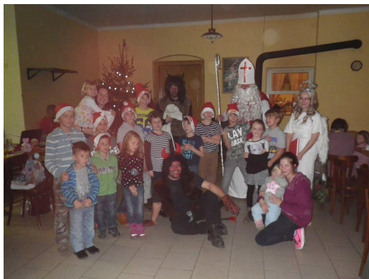
Mikulášská nadílka pro malé i větší děti

V hostinci U Potužáků proběhla mikulášská nadílka pro děti malé i ty větší. Celý podvečer proběhl i přes řádění čertíků ve veselé a přátelské atmosféře. Mikulášovi a jeho družině děkujeme.