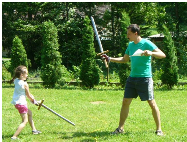
Dětský den - disciplína souboj s meči, kterou si připravil skautský oddíl z Prahy

Zorganizoval hasičský sbor dětský den pro naše nejmenší s mnoha soutěžemi. Děti soutěžily v různých disciplínách a to: skoky v pytlicích, běh v gumákách, chůďy, střelba ze vzduchovky, překážková dráha pro kola a koloběžky, poznávání rostlin a zvířat, skládání puzzle, dráha s hasičskými prvky. Jednu disciplínu připravil skautský oddíl z Prahy, a to souboj s meči a logické skládání obrázců ze sirek. Tento skautský oddíl pořádá každoročně dětský tábor na Novém Dvoře. Dětem udělalo radost také namalování obličejů podle jejich přání.