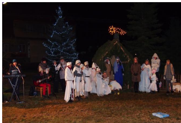
Vánoční hra Živý betlém