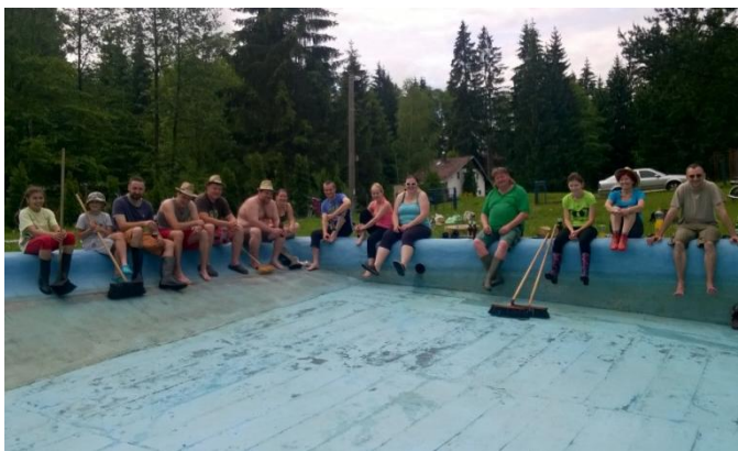
Brigáda - čištění místního koupaliště

Provedl náš sbor jako každoročně čištění požární nádrže. Při této činnosti je nutné, při postupném upouštění, vydrhnout celou nádrž košťaty. Nádrž byla vybudovaná v roce 1977 a slouží též jako koupaliště v letních měsících.