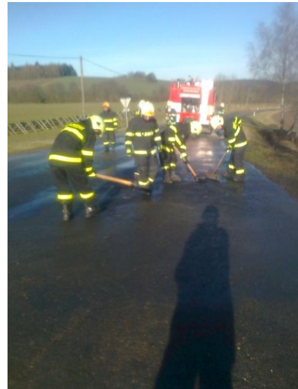
Požár osobního automobilu u obce Křížovice

V poledních hodinách byl operačním střediskem z Plzně vyhlášen poplach naší zásahové jednotce. Vyjízdělo se k požáru osobního automobilu na silnici směrem k obci Křížovice. Jednotka dorazila na požářiště jako druhá v pořadí, po jednotce SDH Kolinec, která prováděla hlavní hašení. Poté dorazila ještě jednotka profesionálních hasičů z Klatov. Naším úkolem, dle pokynů velitele zásahu, bylo zajistit likvidaci úniku provozních kapalin a odstranění trosek ze silnice. Posádce se vozidlo podařilo opustit včas, takže škody byly pouze materiální.